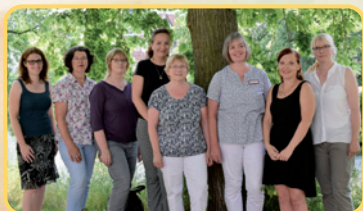
Das Home Care Pflege team